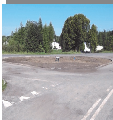
Klomb w Drutarni przed upiększeniem